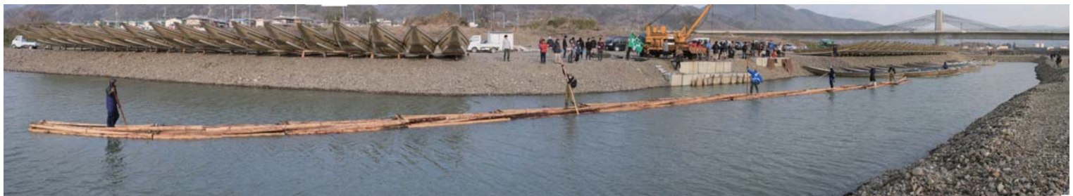
復活した12連筏 2014年2月16日