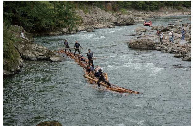
保津峡を下る筏 2009年9月9日