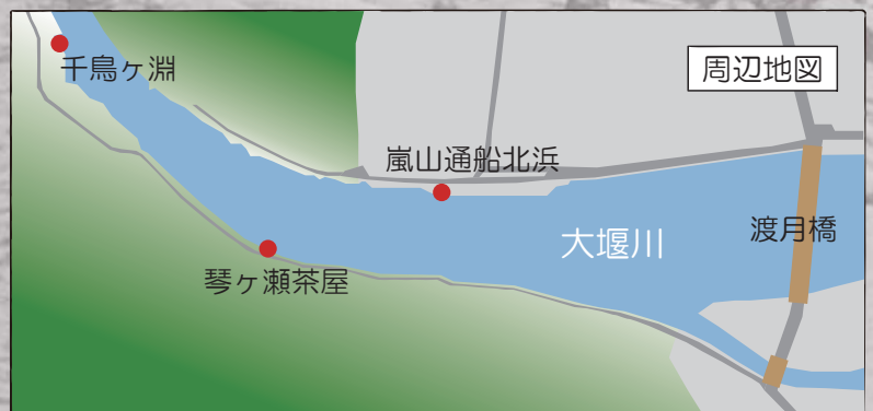
表紙画像：明治～大正期の大堰川の筏流しの様子（絵はがき）