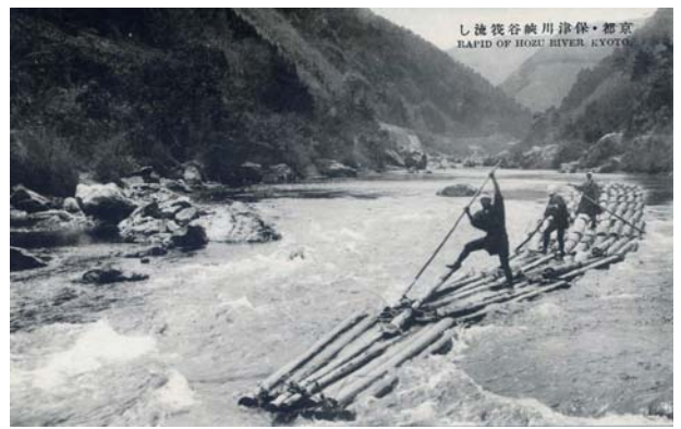
保津川の筏流し 昭和初期の絵葉書

京筏組は、この貴重な歴史遺産を多くの方々方が体験し、かつて流域を結んだ川の営みを実感していただくことで、「筏がつなぐ歴史の記憶」を甦らせたいと考えています。