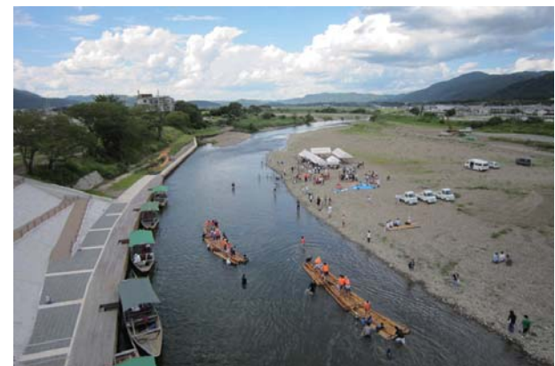
いかだ試乗会 2012年9月15日